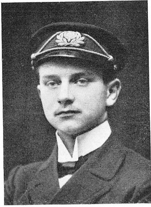
DEPPE, Charles, né le 31 octobre 1894, à Bruxelles.

Trouva la mort des braves, le 30 juillet 1915, en défendant héroïquement le poste avancé de Beverdyck (Rams cappelle) dont il avait été chargé d'assurer la protection.